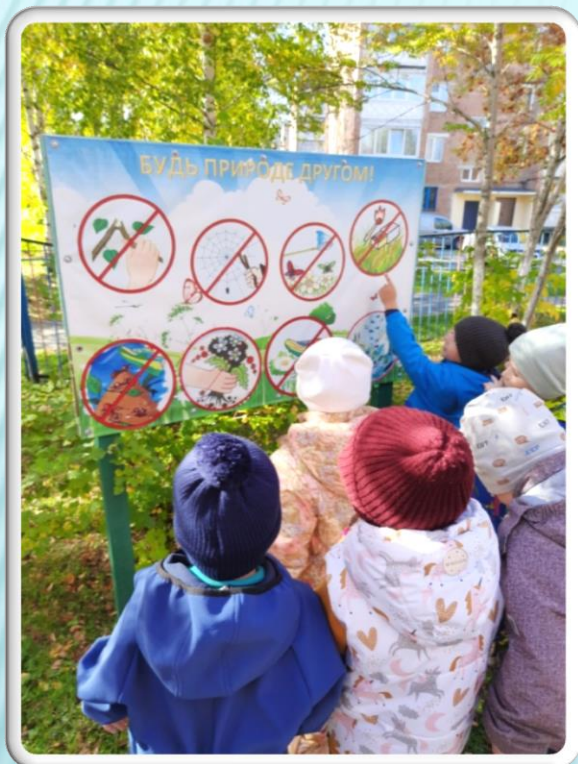
Знакомство детей с экологическими знаками