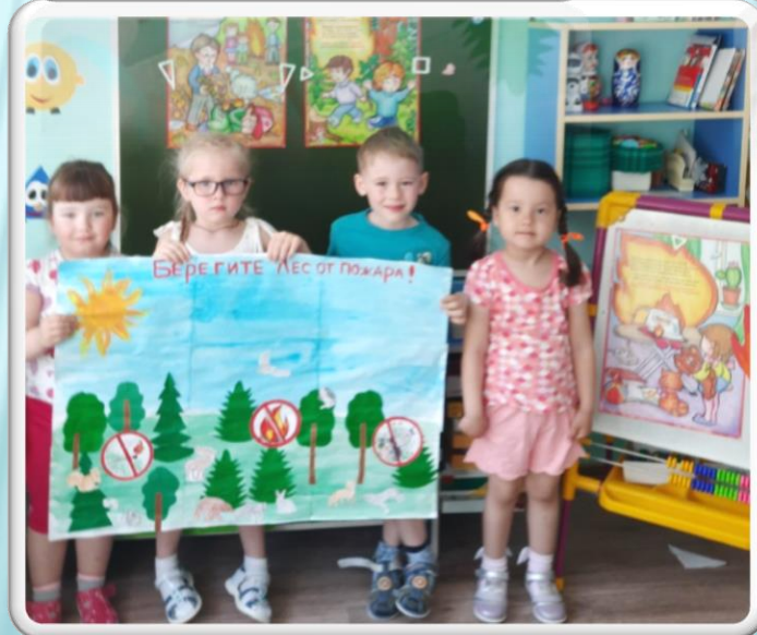
НОД Коллективная работа, плакат «Берегите лес от пожара»