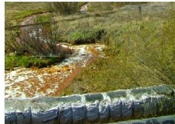
Загрязнение водных объектов