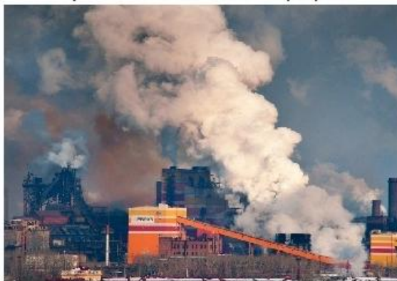
1. Загрязнение атмосферы