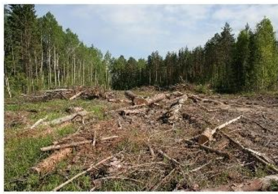
3. Вырубка лесов