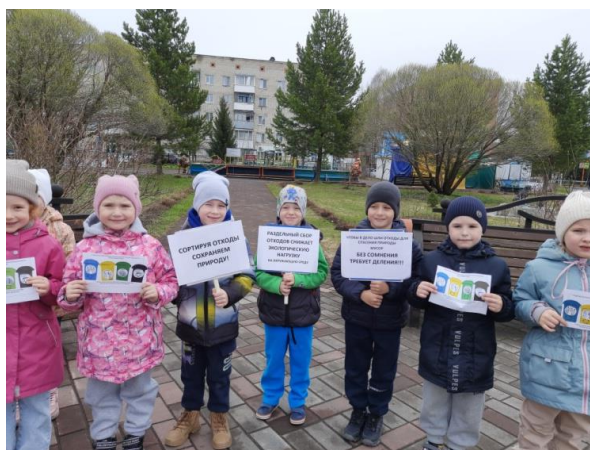
Дидактическая игра «Учимся сортировать мусор» Лепбук «Сортировка мусора»